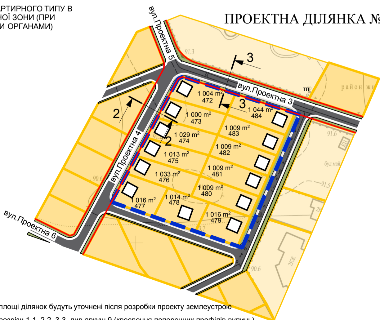
ПРОЕКТНА ДІЛЯНКА №2

Примітка: площі ділянок будуть уточнені після розробки проекту землеустрою